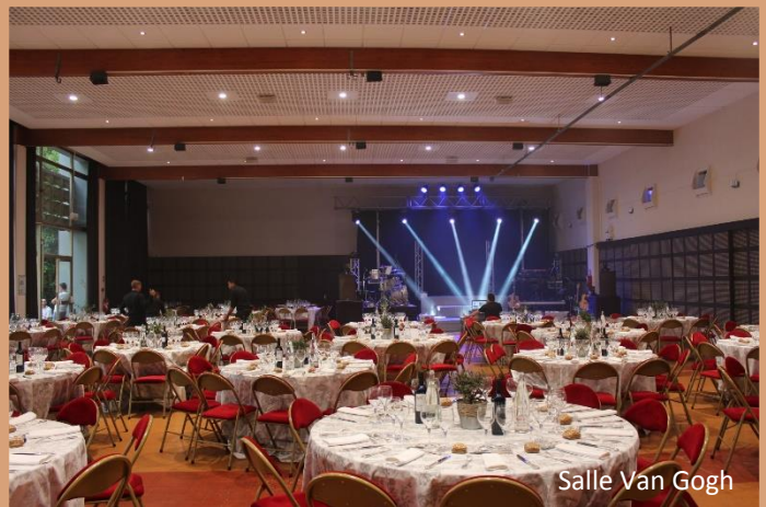
Salle Van Gogh