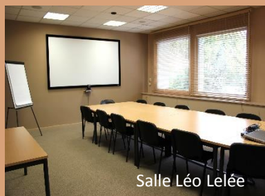
Salle Léo Lelée